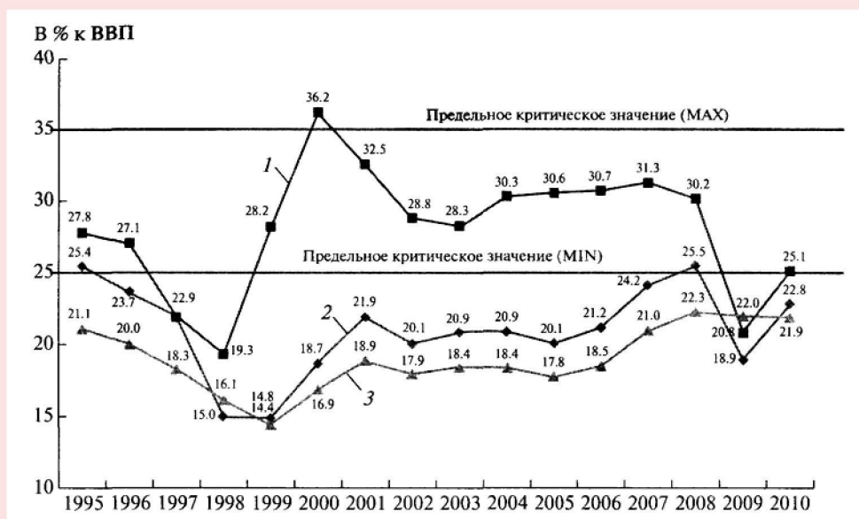
Рисунок 4. Валовое накопление и валовые сбережения в российской экономике в 1995 – 2010 гг., % к ВВП

1 – валовые сбережения; 2 – валовые накопления; 3 – валовое накопление основного капитала