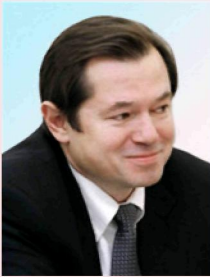
Сергей Юрьевич ГЛАЗЬЕВ