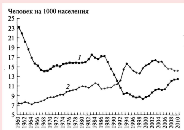
Рисунок 1. Общие показатели рождаемости и смертности в СССР и России в 1960 – 2010 гг.

Оба ключевых демографических показателя — коэффициент рождаемости и коэффициент смертности — на протяжении длительного времени находятся далеко за пределами критических значений (табл. 1). Следствием этого является устойчивое снижение численности населения. Согласно имеющимся демографическим прогнозам, при сохранении сложившихся тенденций к 2030 г. оно может сократиться до 127 млн. человек с тенденцией дальнейшего уменьшения.